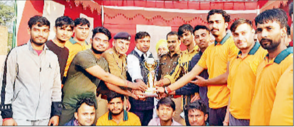
गोहाणा। विजेता टीम बड़ौता वॉरियर्स टीम को ट्रॉफी प्रदान करते पुलिस अधिकारी।