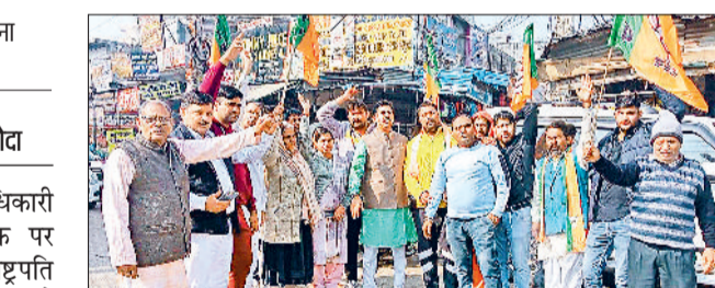
खरखौदा। दिल्ली चौक पर पुतला दहन करते भाजपा कार्यकर्ता।