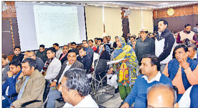
सोनीपत। बैठक के दौरान अपनी शिकायत रखते हुए लोग।

जैसे ही लाइन में लगे लोगों की शिकायत लेने को मंत्री कुर्सी से उठे तो हंगामा शुरू किया दिया पुलिस ने लोगों को समझाया, 15 शिकायतों में से 12 का मौके पर समाधान